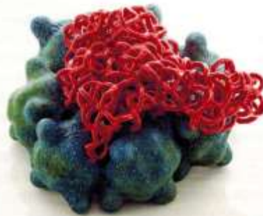
"Erupting Earth Cloud Cluster" Tessa Eastman

PULS Contemporary Ceramics , Edelknaapstraat 19, rue du Page (Châtelain), Brüssel. www.pulsceramics.com | mail@pulsceramics.com