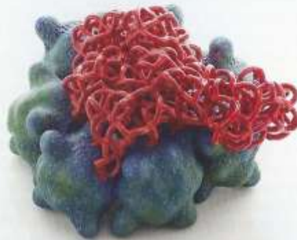
Erupting Earth Cloud Cluster by Tessa Eastman

Founded by Annette Sloth , Puls represents the supreme of international contemporary ceramics. Eastman and Fargo are recent graduates from the reputable Royal College of Art Ceramics and Glass Masters course. Eastman is busy making new pieces for the show which possess a curious ambiguity. Through developed form and multiple glaze fired surfaces, her interest in the detail of microscopic arrangements are revealed. Eastman believes the otherworldliness of natural phenomena assists in helping transport viewers away from the mundane, where grouped pieces possess a sensuous physicality and embodied character. The dynamism produced when repetitive parts in growing systems mutate parallels the trials and tribulations of life. She hopes the shift from geometry to irregularity, order to chaos in the pieces will help raise questions about the complex and transient states that make up living beings. Time is devoted to glaze research so that surfaces awaken gratification of the physical senses. Coloured glazes are selected for their blending and clashing qualities. It is through sensitivity to form and surface that pieces become animated. PULS Contemporary Ceramics, Edelknaapstraat 19 rue du Page (Châtelain), Brussels. www.pulsceramics.com | mail@pulsceramics.com